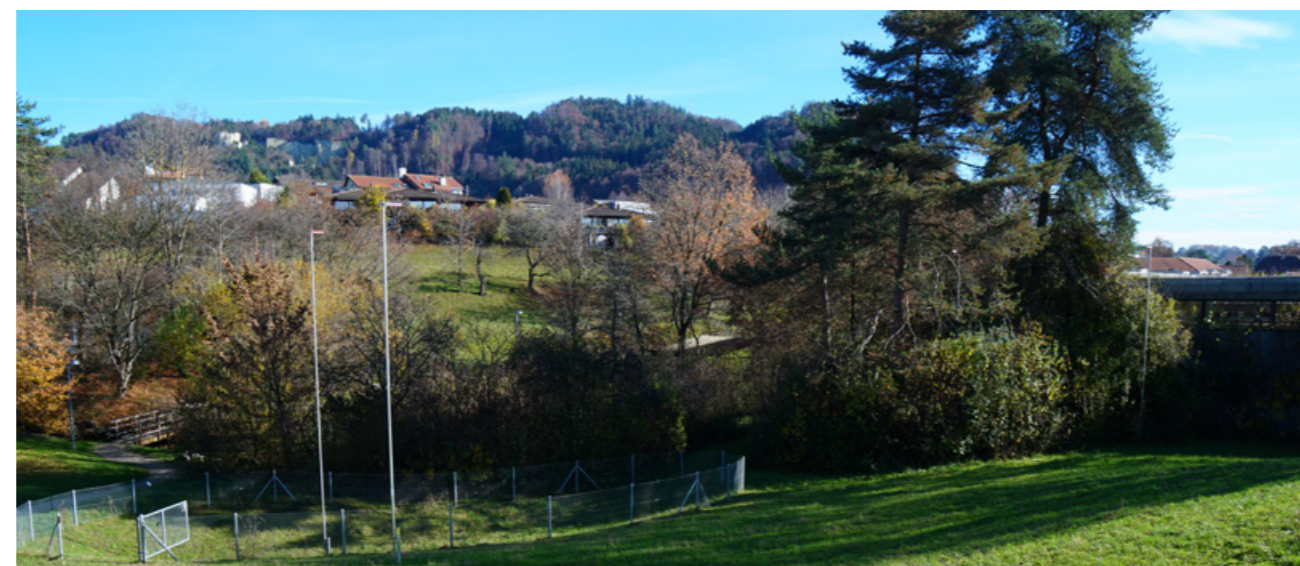
Schul- und Sportanlage Lutertal. Neubauprojekt Kindergarten und zusätzlicher Schulraum.