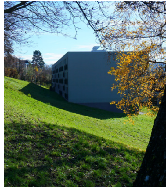
Blick auf Wohnungen Lutertalpark