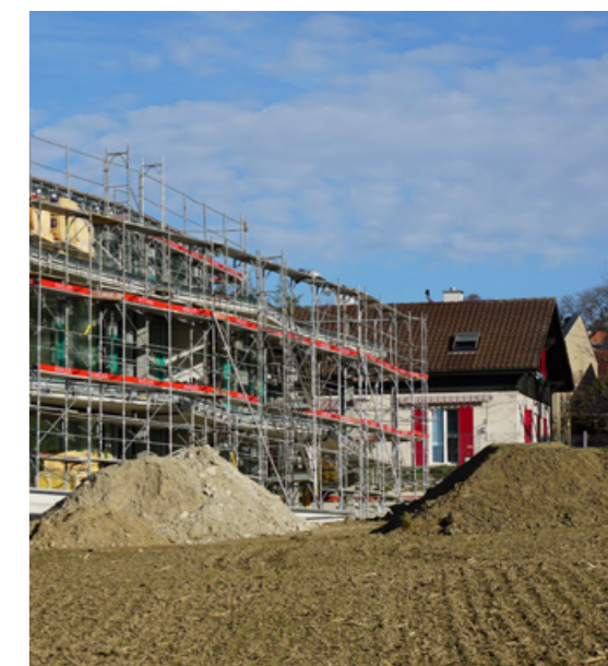
Neubau an der Krauchthalstrasse