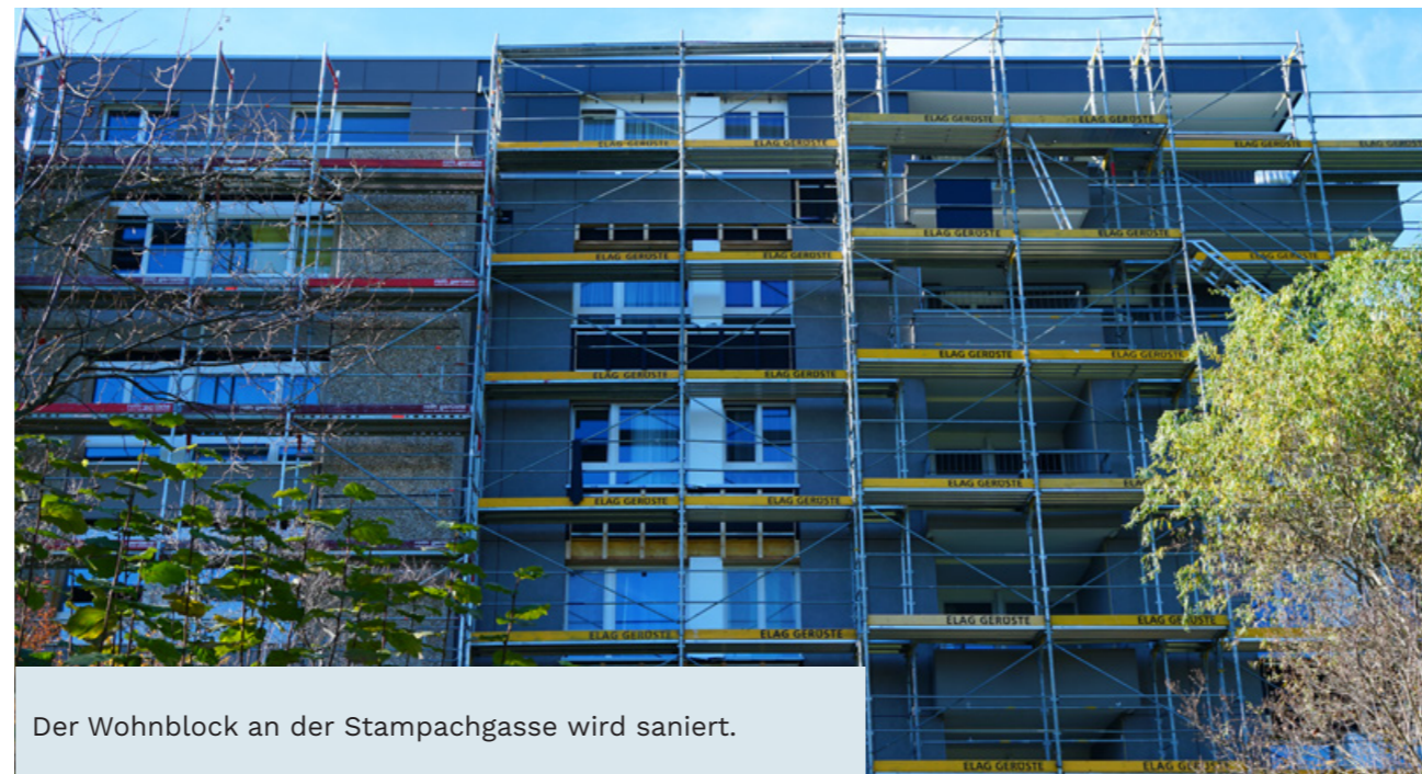
Der Wohnblock an der Stampachgasse wird saniert.