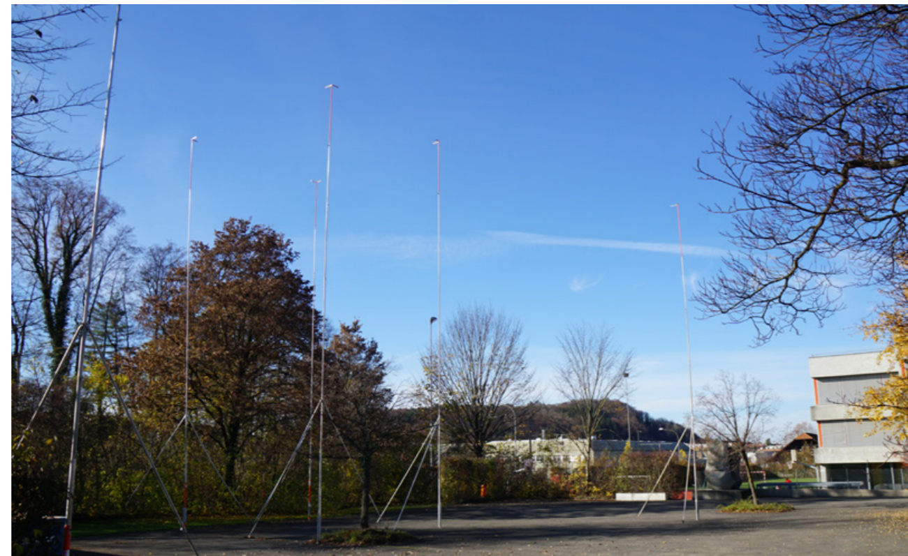
Neubauprojekt Musikschulhaus Bolligen.

Neue Sport- und Freizeitbedürfnisse und steigende Anforderungen an Sportinfrastruktur