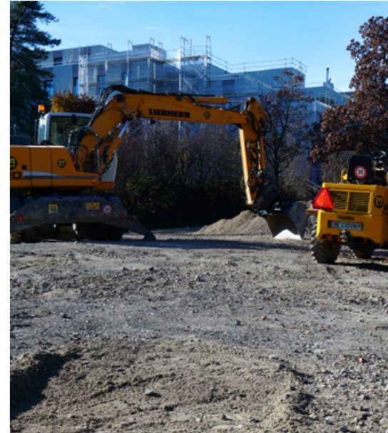
Fernwärme für Bolligen