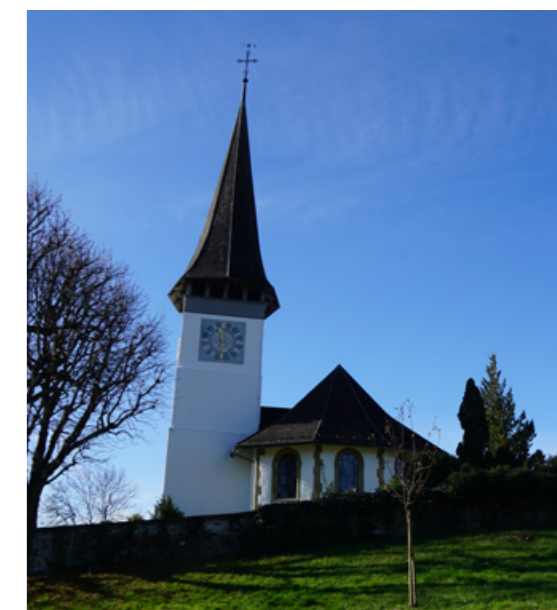
Evangelisch-reformierte Kirche Bolligen