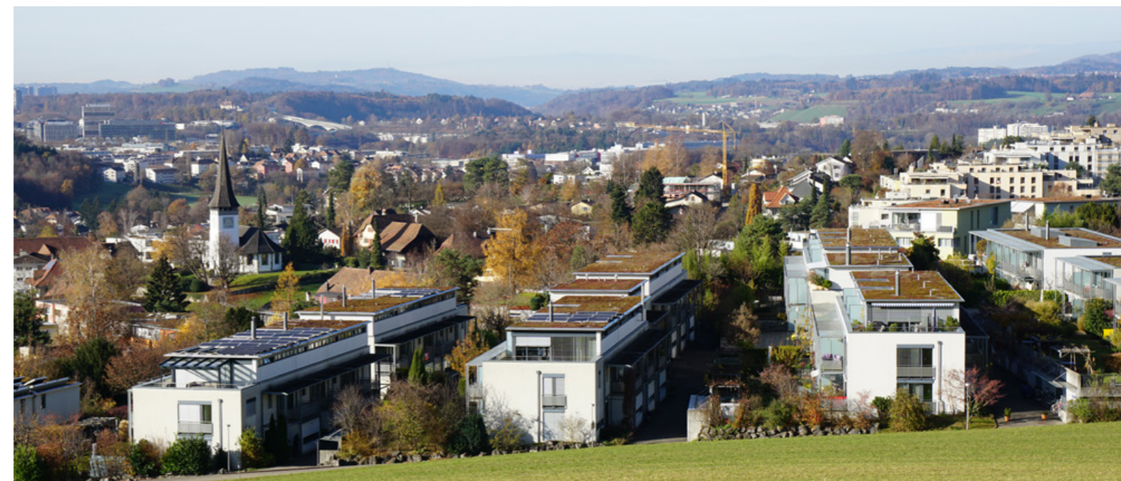
Blick auf Bolligen ab Feltscherweg.

Der überarbeitete Finanzplan zeigt, dass nicht alle Ziele erreicht werden. Der Gemeinderat ist sich dessen bewusst und hält an der eingeschlagenen Strategie fest. Die überdurchschnittlich hohen Investitionsprojekte werden wie geplant umgesetzt. Nur so gelingt es mittelfristig den Nachholbedarf abzubauen, die Infrastrukturanlagen auf einen guten Stand zu bringen und deren Nutzung in Zukunft zu sichern. Eine Finanzierung mit Schulden und damit eine Mitfinanzierung durch die Folgegenerationen sind gerechtfertigt, da auch sie einen direkten Nutzen aus den Investitionen erhalten.