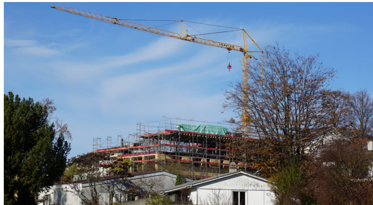
Blick auf den Neubau an der Brunnenhofstrasse.