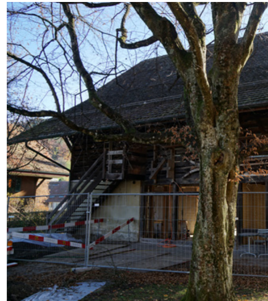
Umbau Pfrundschiür zu neuem Kindergarten