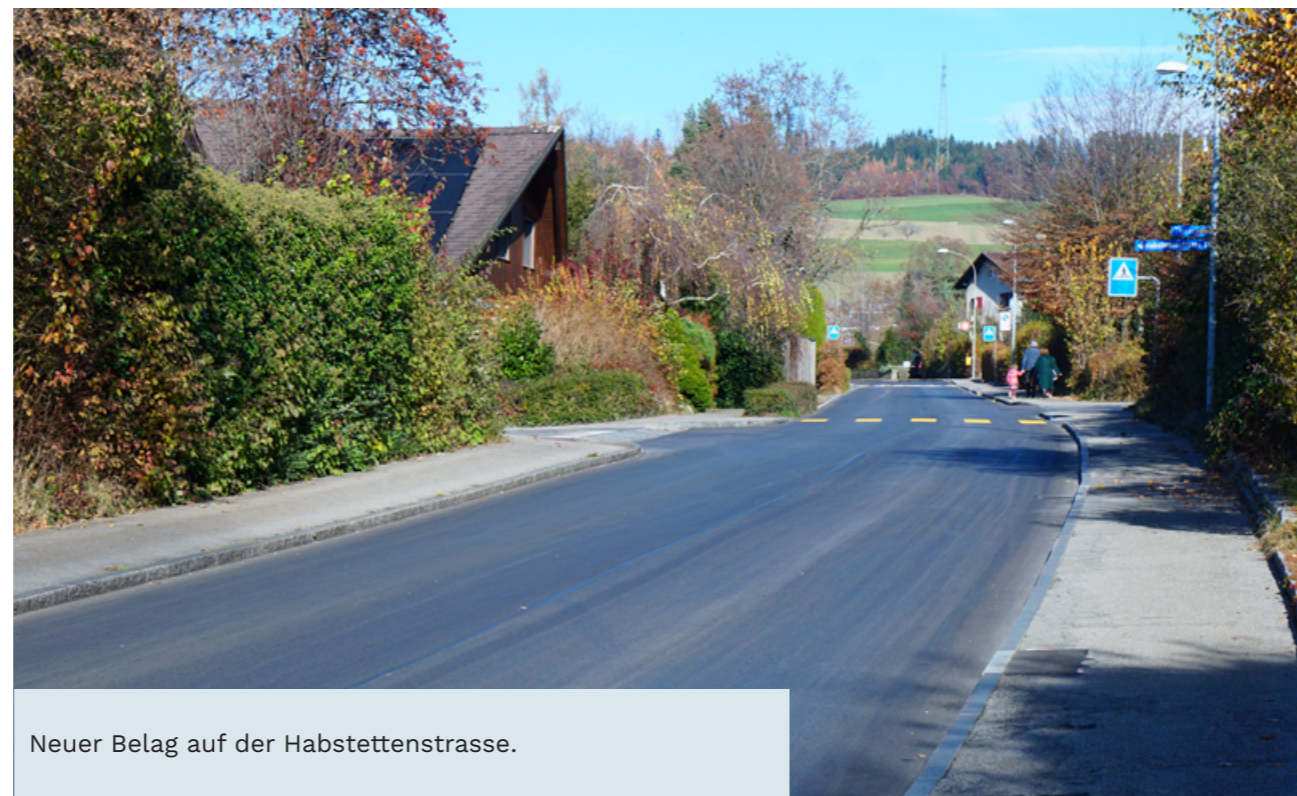
Neuer Belag auf der Habstettenstrasse.