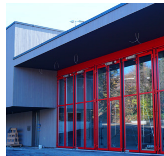
Neues Feuerwehrmagazin im Bau.