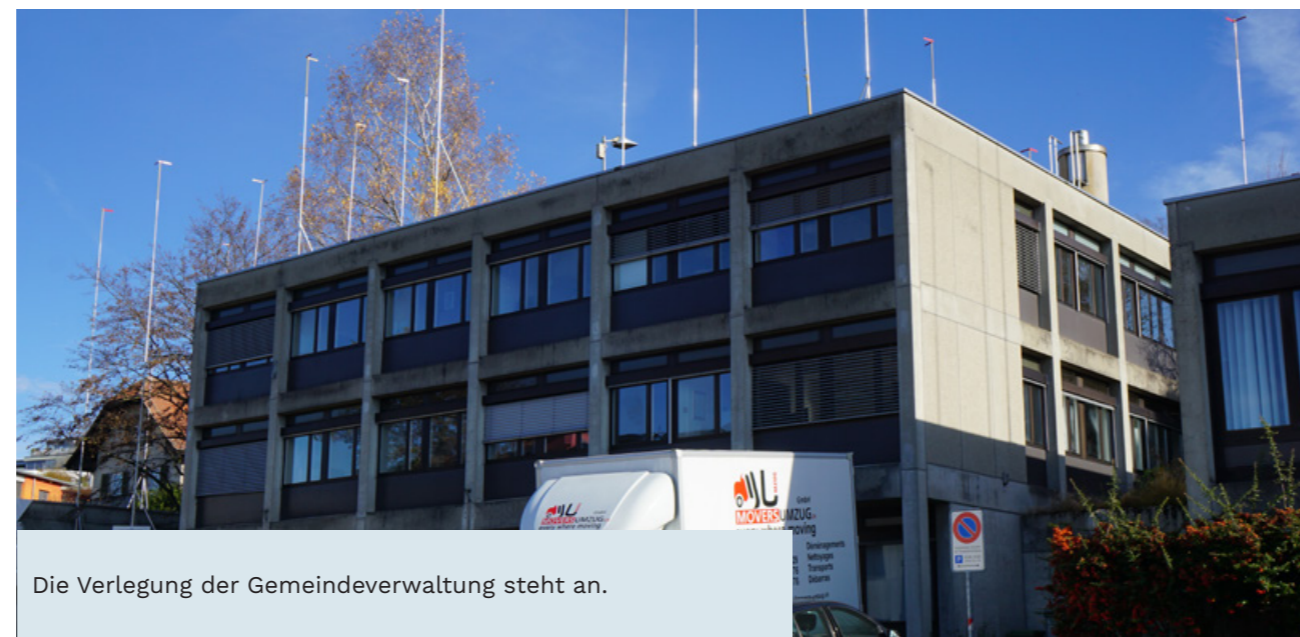
Die Verlegung der Gemeindeverwaltung steht an.