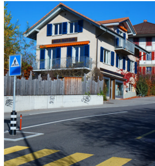
Sicherer Schulweg dank dem Fussgängerstreifen auf der Kantonsstrasse