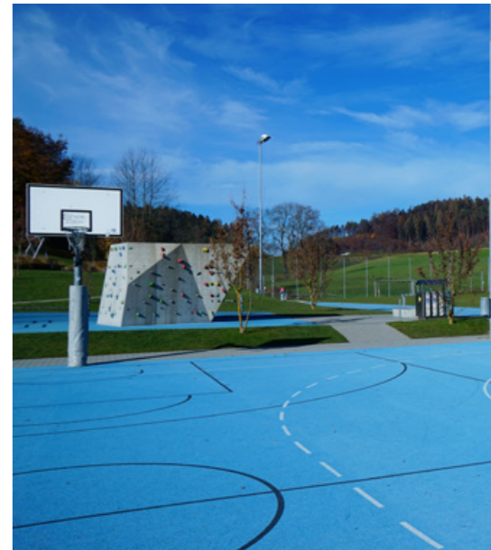
Aussenplatz der Schulanlage Luteretal