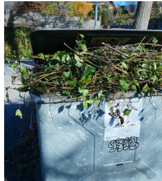
Container bereit für die Grünabfuhr