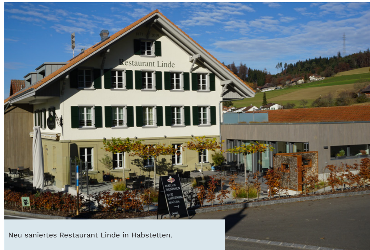
Neu saniertes Restaurant Linde in Habstetten.