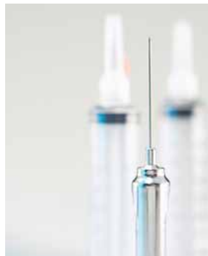
Bild 5 Die Impfung gegen FSME bietet sehr guten Schutz.