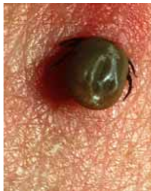
Bild 4 Zecke entfernen: Zecke direkt über der Haut mit Pinzette oder spezieller Zeckenzange fassen und senkrecht zur Hautoberfläche herausziehen. Stichstelle desinfizieren.